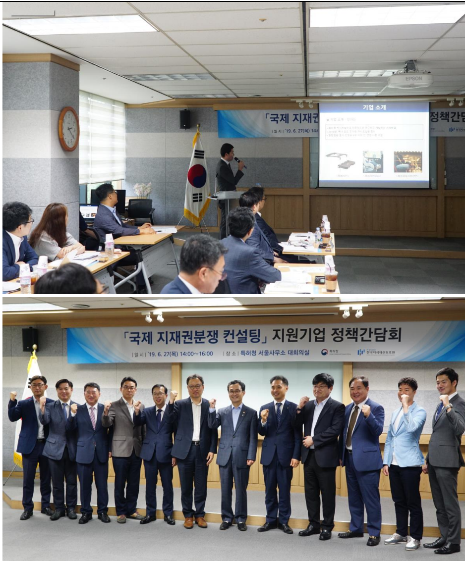
<특허청 우수사례 선정 및 특허청장 발표>